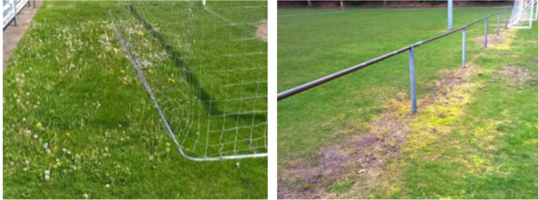
Figuur 3 - Onderbespeling en scalperen van de grasmat zijn belangrijke oorzaken van onkruidgroei

Een motormaaier heeft voorkeur boven een bosmaaier, omdat de maaihoogte beter is te reguleren. Frequenter maaien van goed groeiend gras geeft een dichtere zode. Schrale stroken met veel mos kunnen in het voorjaar het best licht bemest worden.