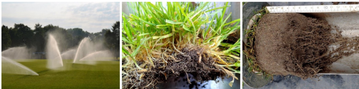
Figuur 4 - Te vaak beregenen leidt tot een dichte, zwakke grasmat met veel straatgras, vilt en oppervlakkige wortels. Diep wortelende sportveldgrassen maken de grasmat robuuster

Begin met beregenen als het onderste 1/3-deel van de wortelzone nog net vochtig aanvoelt. Maak ter controle een steek met een spa of een guts tot minimaal 20cm diep. Geef per keer zoveel water dat de grond tot iets onder de wortelzone goed vochtig is. Meer is verspilling. Alleen pas ingezaaid gras moet in droge perioden vaak dagelijks worden beregenend. Zodra de grasgroei doorzet, is het zaak om de beregeningsfrequentie af te bouwen.