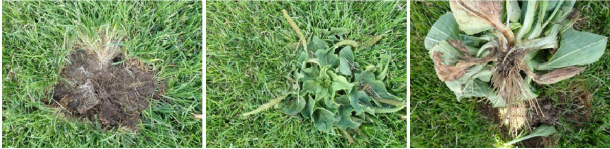
Figuur 2 - Onkruiden verdringen het gras. Het is verstandig ze uit te steken voor de bloei om uitzaaien tegen te gaan

Het is belangrijk om te signaleren wanneer bepaalde onkruiden toenemen en wanneer er sprake is van schade door ziekten of plagen. Preventie en bestrijding van ziekten en plagen is vooral een taak voor de professionele beheerders. Vrijwilligers mogen op sportvelden geen pesticiden gebruiken. Incidentele onkruiden kunnen het beste handmatig, voor de bloei, worden uitgestoken.